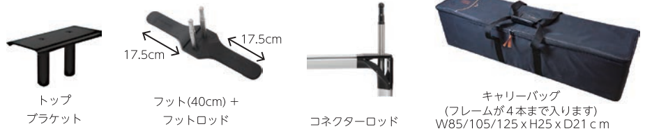
キャリーバッグ (フレームが4本まで入ります) W85/105/125 x H25 x D21 cm